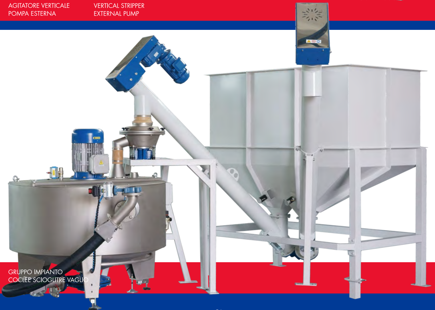
GRUPPO IMPIANTO COCLEE SCIOGLITRE VAGLIO