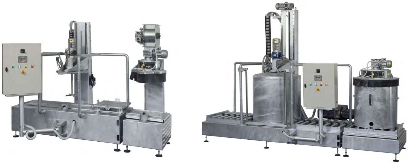
GRUPPO SCIOGLITURA GESSI GYPSUM DISSOLVING UNIT