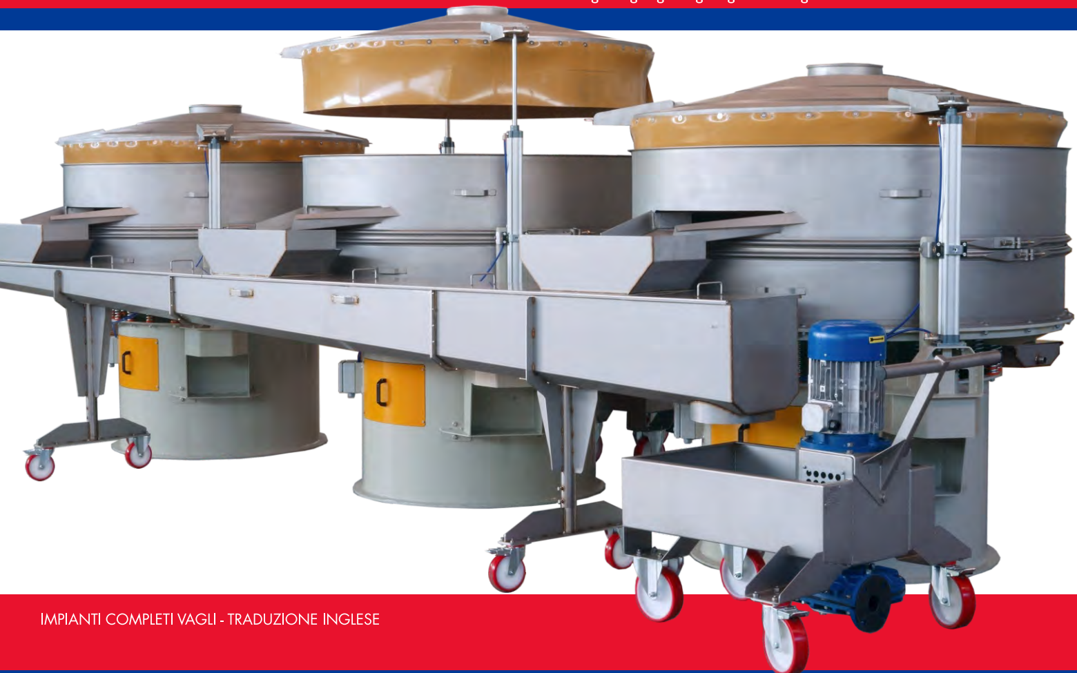
IMPIANTI COMPLETI VAGLI - TRADUZIONE INGLESE